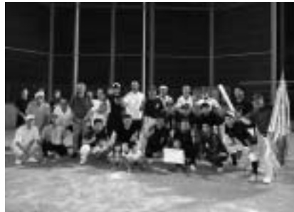
優勝した福田のみなさん