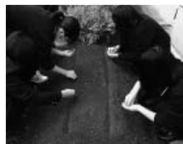
一粒ずつの種まき

デュース計画～の実践として、地域の歴史、産業等について新たな価値を見だし、地域のあり方を考察することを通して、ふるさと兵庫を愛する