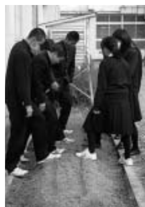
強く育てるための麦ふみ

デュース計画～の実践として、地域の歴史、産業等について新たな価値を見だし、地域のあり方を考察することを通して、ふるさと兵庫を愛する