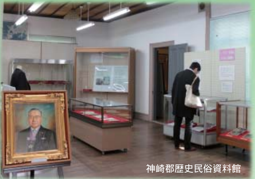
神崎郡歴史民俗資料館