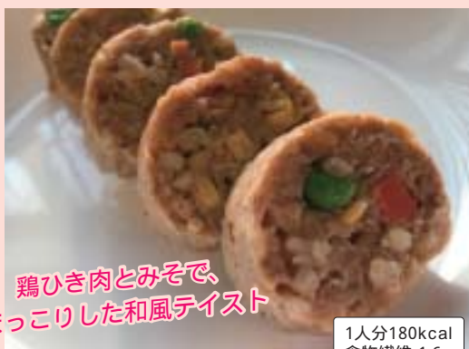
鶏ひき肉とみそで、ほっこりした和風テイスト