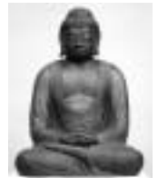
木造阿弥陀如来坐像

このたび、木造阿弥陀如来坐像(神積寺)、銅造誕生釈迦仏立像(應聖寺)の2件が、新たに福崎町指定文化財になりました。これを機に、町内に伝存する数々の優れた仏像を、わかりやすく紹介していただきます。