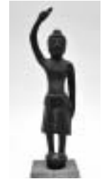
銅造誕生釈迦仏立像